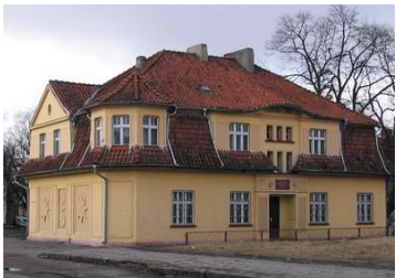
Здание музыкальной школы (Довоенной постройки)

Историческая справка. Город Славск основан в 1292 г. как селение Хайнрихсвальде - "лес Генриха". До 1945 г. входил в составе Германии (Восточная Пруссия). С 1818 г. административный центр местности Эльхининдерунг. С 1890 г. - климатический курорт. В 1919 г. был построен бассейн с минеральной водой (минеральные воды курорта до 1945 г. поставлялись в Дрезден). В 1946 г. переименован в Славск.